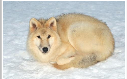
une loup arctique