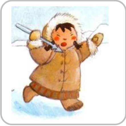
une jeune Inuit