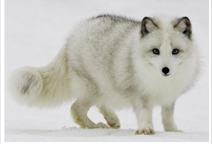
un renard polaire