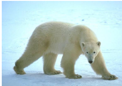
un ours blanc