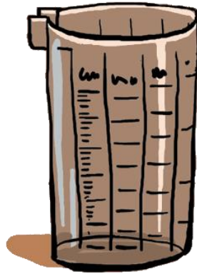
un verre doseur