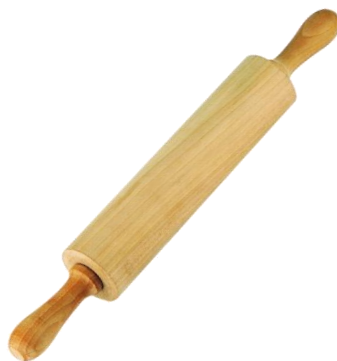
rouleau à pâtisserie